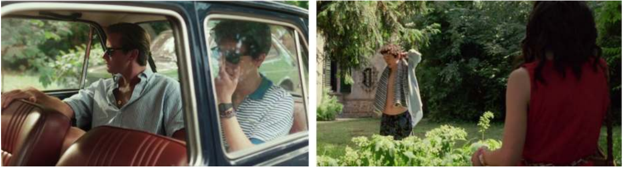
Obr. 9 a 10. Zábery z filmu Call Me by Your Name (2017, r. Luca Guadagnino)

Hranice jasne organizujú vzťahy. V scéne v pracovni prevláda pedantná kompozícia, každý má v obraze svoj vyhradený priestor, Elio sa stráca medzi vecami a pozoruje Olivera spoza nich. Kamera pritom prechádza do detailov a polocelkov, takže si postavy sú blízke, ale každá má jasne ohraničený osobný priestor a Guadagnino v týchto momentoch využíva obrazovú schému obalu.