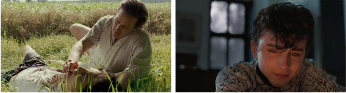
Obr. 19 a 20. Zábery z filmu Call Me by Your Name (2017, r. Luca Guadagnino)

koža. V záverečnej scéne po tom, čo Oliver oznámi Eliovi svoje zásnuby, je vonku zima a sneh a vidíme Elia ako plače pri ohni. Guadagnino nám dáva vzruchový odkaz na leto, ktoré spolu protagonisti prežili.