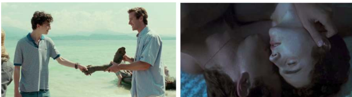
Obr. 13 a 14. Zábery z filmu Call Me by Your Name (2017, r. Luca Guadagnino)

Sympóziom a antickú predstavu o prapôvodnom spojení dvoch tel 107 , ktoré Zeus rozdelil na polovicu.