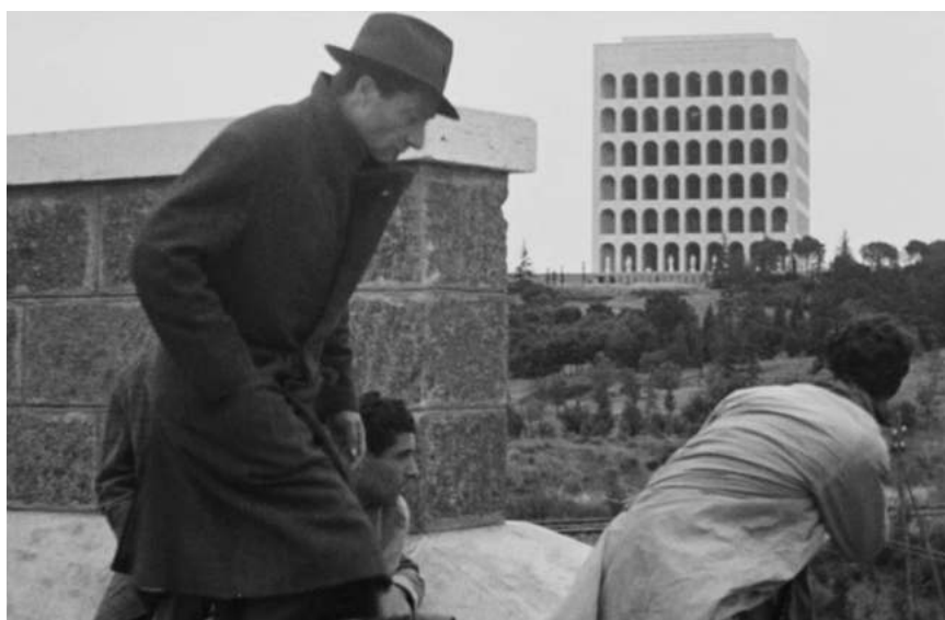
Obr. 7. Záber z filmu Rím, otvorené mesto (1945, r. Roberto Rossellini)

Môžeme tiež uvažovať o tom, že symetria Štvorcového kolosea uľahčuje kognitívny proces tvorby tzv. view-independent modelu objektov, ktorý si v mozgu synesteticky skladáme z rôznych dostupných poznatkov a sensorických informácií 45 . Zníženie kognitívnej záťaže znamená menej vynaloženej energie pre telo a s tým spojené uspokojenie. Navyše, klasické sochy v prízemných otvoroch tejto budovy ukazujú ľudskú mierku a akoby vyznačovali naše miesto v tejto štruktúre. Veci sú tu tak, ako majú byť.