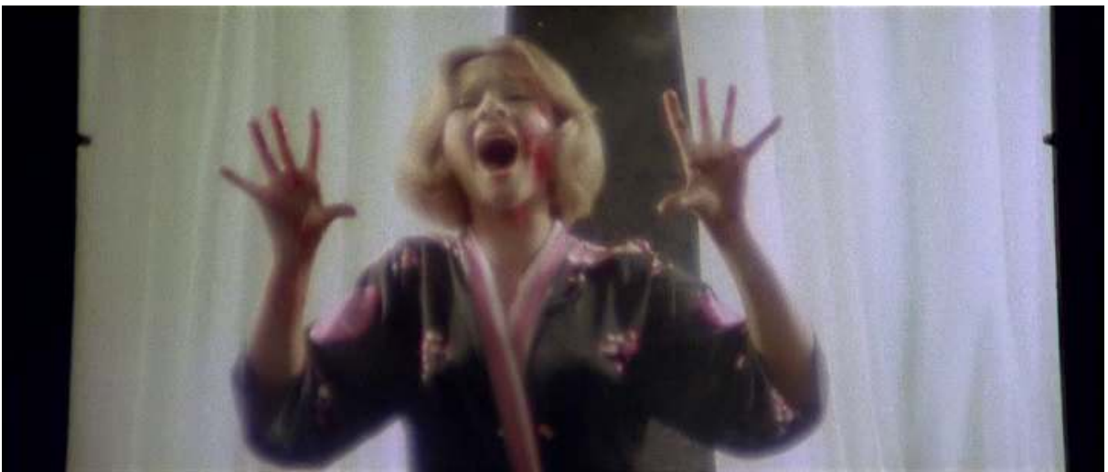
Obr. 25. Záber z filmu Profondo rosso (1975, r. Dario Argento)

Večer na pozadí moderných kulís Turína sa britský pianista Marcus baví so svojim priateľom, keď v tom zrazu obaja začujú výkrik. Kamera sa obracia na jeden zo šedivých obytných domov a cez okno sledujeme brutálny útok na ženu. Vrah, ktorého vidíme len v siluete, ju udiera sekáčom do hlavy a do krku sa jej zabodávajú kusy skla z rozbitého okna. Marcus sa náhle ocitá uprostred vyšetrovania série záhadných vrážd. Podarí sa mu odhaliť ich páchatel'a? Takto by sa dala zhrnúť expozícia žánrovky Profondo rosso (1975), ktorú dva roky pred svojou kultovou Suspiriou natočil Dario Argento. Rovnako ako v nej, ani tu nie je narácia obzvlášť jasná a predvídateľná, ale ani smerodajná. Profondo rosso je zaujímavé tým, ako Argento režíruje scény s ohľadom na embodiment a príbeh využíva najmä ako plochu, na ktorej môže manieristicky rozmiestniť krvavé atrakcie.