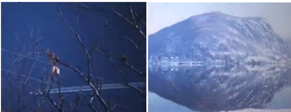
Obr. 23 a 24. Zábery z filmu Terra 0/0 (1972, r. Gianfranco Brebbia)

fenomén UFO 120 a samotný názov filmu Terra 0/0 by mohol byť odkazom ku kozmickému pôvodu tejto filmovo-ludskej hybridnej sondy.