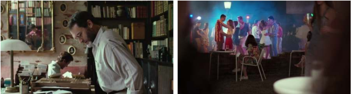
Obr. 11 a 12. Zábery z filmu Call Me by Your Name (2017, r. Luca Guadagnino)

Hranice jasne organizujú vzťahy. V scéne v pracovni prevláda pedantná kompozícia, každý má v obraze svoj vyhradený priestor, Elio sa stráca medzi vecami a pozoruje Olivera spoza nich. Kamera pritom prechádza do detailov a polocelkov, takže si postavy sú blízke, ale každá má jasne ohraničený osobný priestor a Guadagnino v týchto momentoch využíva obrazovú schému obalu.