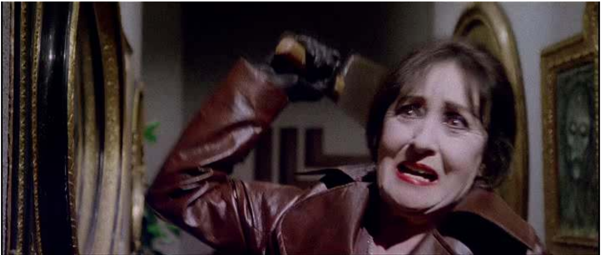
Obr. 28. Záber z filmu Profondo rosso (1975, r. Dario Argento)

Násilie páchané či hroziace Marcusovi, s ktorým sa máme stotožniť a o ktorého sa máme báť, je vedené realisticky proti okolitému kódu filmu. Pozrime sa napríklad na záverečnú scénu – keď si psychotická matka, odhalená ako monštrum filmu, spomína na vraždu svojho manžela, jej flashback je rámovaný v celku a pohyby postáv sú štylizované do strnulosti podľa prísneho kódu. Keď sa naopak žena snaží sekáčom zaútočiť na Marcusa, násilie sa zrazu deje v (polo)detailoch a je dynamické a bolestivé.