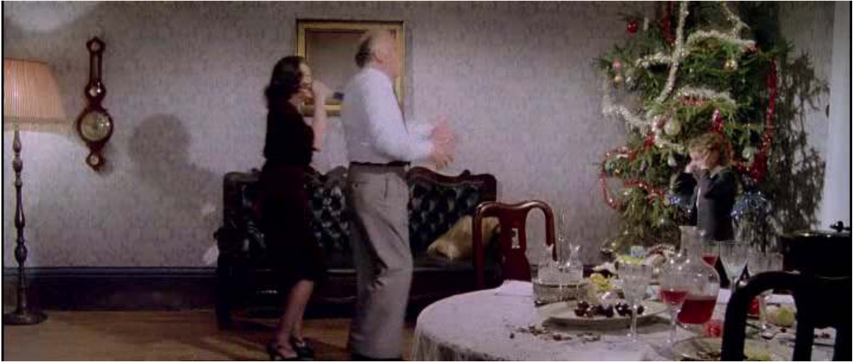
Obr. 27. Záber z filmu Profondo rosso (1975, r. Dario Argento)

Násilie páchané či hroziace Marcusovi, s ktorým sa máme stotožniť a o ktorého sa máme báť, je vedené realisticky proti okolitému kódu filmu. Pozrime sa napríklad na záverečnú scénu – keď si psychotická matka, odhalená ako monštrum filmu, spomína na vraždu svojho manžela, jej flashback je rámovaný v celku a pohyby postáv sú štylizované do strnulosti podľa prísneho kódu. Keď sa naopak žena snaží sekáčom zaútočiť na Marcusa, násilie sa zrazu deje v (polo)detailoch a je dynamické a bolestivé.