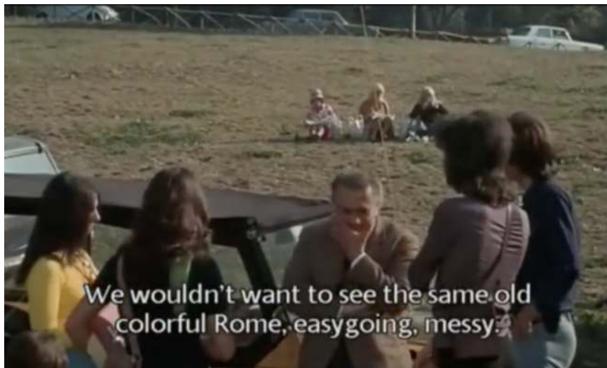
Obr. 1. Záber z filmu Felliniho Rím (1972, r. Federico Fellini)

Telesnosť filmu je pomerne starým fenoménom a Taliansko má v jej kontexte svoje miesto: bol to historický blockbuster Cabiria , ktorý pred viac než 100 rokmi zaviedol v kinematografii trend pohyblivej kamery ( Cabiria movement ), čím pomohol oslobodiť film z otroctva statických záberov a dostať ho bližšie k bezprostrednosti ľudského pohybu v priestore. Boli to tiež telá idealizovaných svalnáčov ( Maciste ) a zborové jednanie stoviek komparzistov v historických eposoch ( coralità ), ktoré prišli ako predzvesť nastupujúcich fašistických ideálov, a na nasledujúcich stranách by som chcel ukázať, že práca s telesnosťou sa od svojich politických implikácií nedá jednoducho očistiť, hoci sa o to kognitívna veda snaží. Talianske dedičstvo je dodnes zapísané v genetickom kóde filmu, a aj preto sa vydávam po tejto linke za akousi archeológiou tela filmu, pracujúc s predpokladom, že embodiment bude dôležitým výrazovým prostriedkom talianskej kinematografie a bude pritom otvárať otázky filmovej etiky a ideológie.