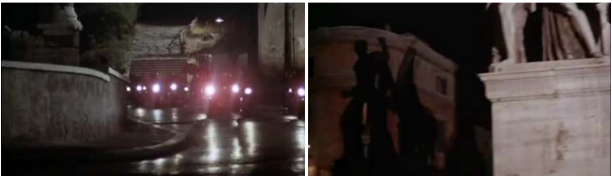
Obr. 2 a 3. Zábery z filmu Felliniho Rím (1972, r. Federico Fellini)

Prečo pri sledovaní tejto scény nie sme zmätení?