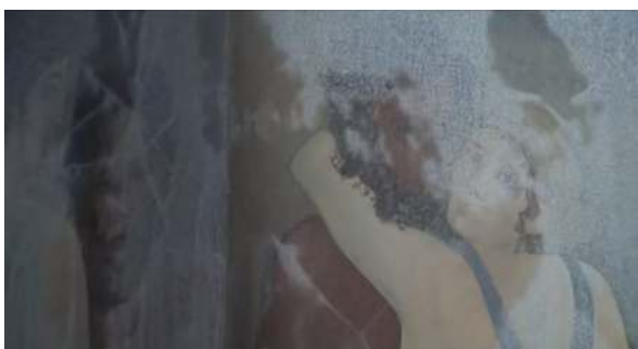
Obr. 4 a 5. Zábery z filmu Felliniho Rím (1972, r. Federico Fellini)

Abstraktný horor vzduchu v okamihu brutálne ničí krásu, v ktorej sme sa práve ocitli. Bolestivý mystický zážitok z tejto scény môže divák, so slzami v očiach, len veľmi ťažko reflektovať prostredníctvom jazyka. Nanajvýš by ho bolo možné prirovnať ku strate končatiny. Fellini akoby útočil na našu samotnú existenciu, lebo len na jej základe dokážeme dobre posúdiť význam situácie, ktorú nám načrtáva; predostiera komplexný ontologický problém a vysvetľuje ho pomocou telesnosti.