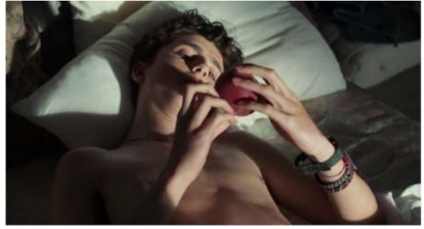
Obr. 15 a 16. Zábery z filmu Call Me by Your Name (2017, r. Luca Guadagnino)

Mimo toho je v Call Me by Your Name fyzická bolesť stotožnená s psychickou bolesťou. Estetické či pohodové scény Guadagnino narúša nepríjemnými pocitmi – vonku je slnečno, Oliver si máča nohy, čľapká po tráve, no počas toho odhaľuje svoje brucho so zapálenou ranou. Ukazuje ho v rôznych ďalších scénach, i v jednej milostnej, kde vďaka tomu z erotiky prechádzame do hnusu, Oliverova rana vyslovene trčí v zábere. Pri návšteve u známych Eliovi z ničoho nič tečie krv z nosa ako odkaz na jeho psychický stav, načo ho Oliver zachraňuje bolestivou masážou nôh. V radostnej scéne s jazdou lesom takmer padáme z kopca s kamerou, jej pohyb vyvoláva závrat; keď je zase Elio nervózný a nešťastný z toho, že ďalší deň Oliver odchádza, Guadagnino ho ukazuje zvracať.