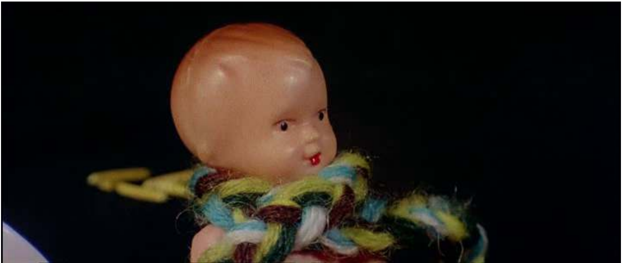
Obr. 26. Záber z filmu Profondo rosso (1975, r. Dario Argento)

nezapadá do ekológie nášho sveta, je záhadnou entitou. Intersubjektivita a interkorporeita medzi nami a ním do nejakej miery fungujú, no vznikajú medzery, ktoré si naša myseľ nevie doplniť, a preto si v nej nemôžeme zrekonštruovať jeho telo, čo vytvára efekt Prízraku ( the Eerie ) podobne, ako ho definoval Mark Fisher vo svojej knihe The Weird and the Eerie .