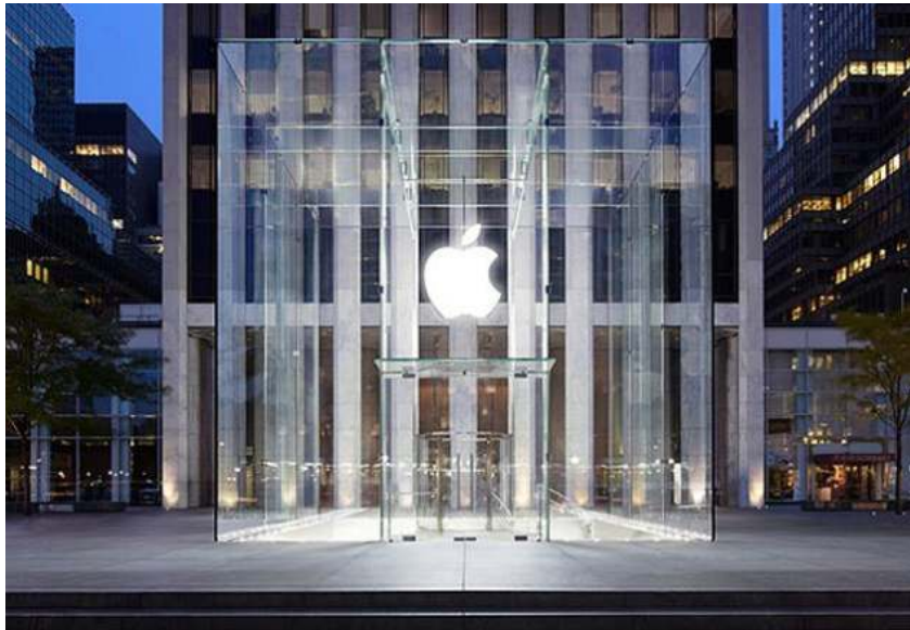
Obr. 8. Predajňa Apple Store 5th Avenue v New Yorku

Je princíp embodimentu zámerne zneužívaný alebo ho len nezámerne premietame do okolitej kultúry? Ak nás výskum EC má naučiť robiť pôsobivejšie, funkčné, strhujúce diela, debata o ich etických dopadoch je v tomto kontexte nevyhnutná.